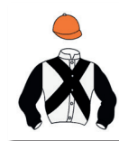
Erick Bec de la Motte