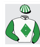
Claude Le Lay