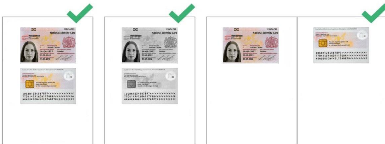
Legible identity card

If you come from a non european country, a copy of 2 identity documents is required.