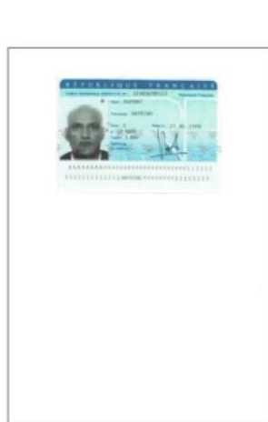
Recto et verso sur un même document PDF