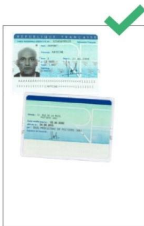
Carte d'identité lisible

Veillez à ce que votre copie soit lisible, non tronquée, bien cadrée et n'oubliez pas de scanner le verso du document (carte d'identité) ou la page sur laquelle figure votre signature (passeport).