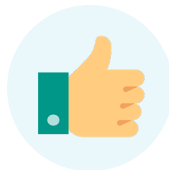
Public (hippodrome & audience)